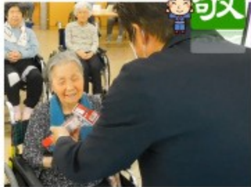
▲代表で記念品を受け取りました